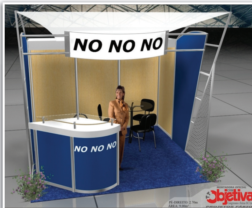
PÉ-DIREITO: 2.70m ÁREA: 9.00m 2